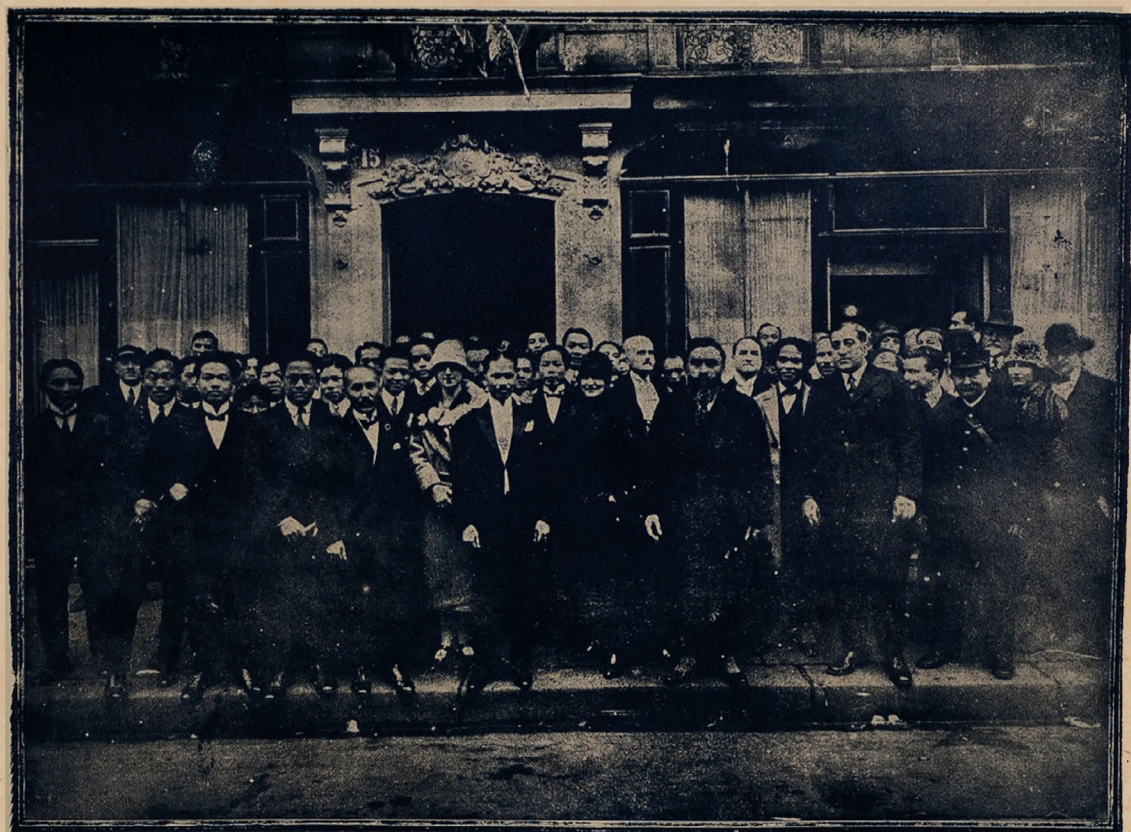
Hội « Đông-Pháp Hỗ-trợ » ( Foyer des Indochinois ) ở Paris nghênh-tiếp quan Toàn-quyền VARENNE